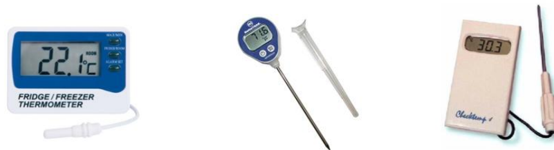
Figura 1. Ejemplos de tipos de dispositivos integrados en una unidad