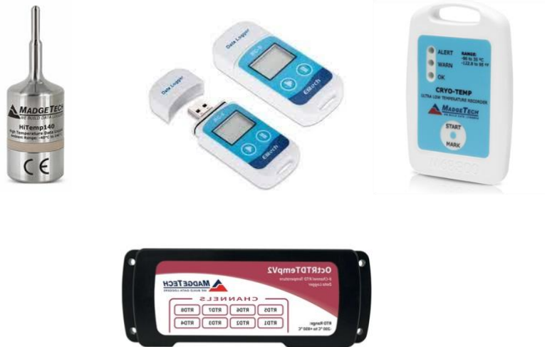
Figura 3. Ejemplos de tipos de datalogger o registradores de temperatura