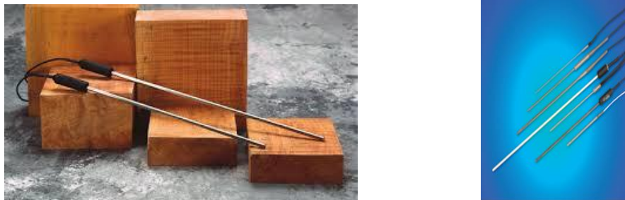
Figura 4. Ejemplos de tipos de sondas PRT