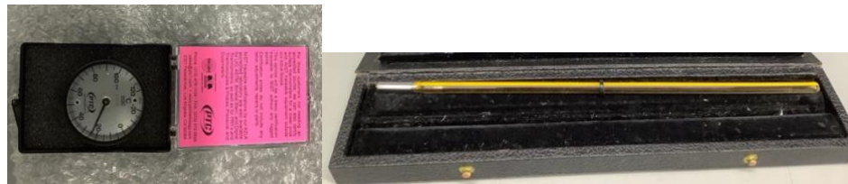
Figura 7. Ejemplo de medios de embalaje

* Para los termómetros de líquido en vidrio se recomienda que la posición sea vertical, esto para evitar la separación del líquido y garantizar su conservación.