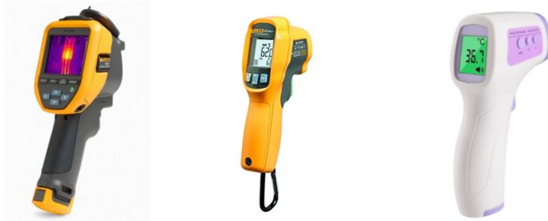
Figura 6. Ejemplos de tipos de termómetros IR y cámaras termográficas