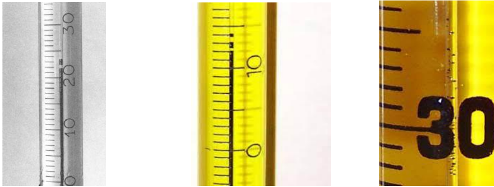
Figura 5. Ejemplos de tipos de separación de líquido