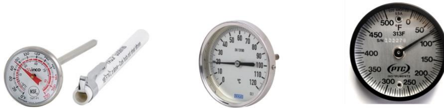
Figura 2. Ejemplos de tipos de termómetros analógicos y de chapa